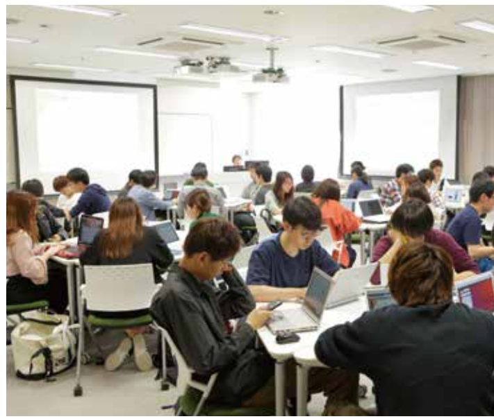
今年の春には大学院も新設した情報セキュリティ学科。2023年春には「情報セキュリティ産学共同研究センター」(仮称)の開設も計画されている。

本学科は、確固たる実践技術を身に付けられる学科です。正義感をもって、情報社会を支えていこうという考えを持つている方の入学を期待しています。