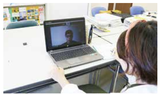
オンラインで先輩からアドバイスを受ける学生