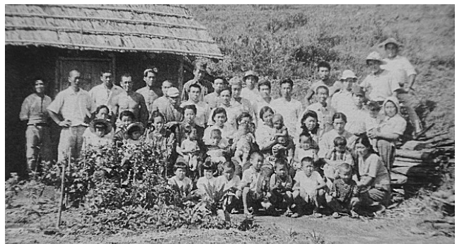
図6 1949年入植者集合写真(入植から2年後)