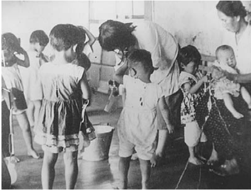
図3 2 開拓保健婦と季節保育所②