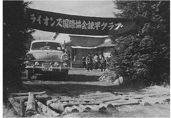
図4 無料医療奉仕団による健康診断(田崎宅庭にて)