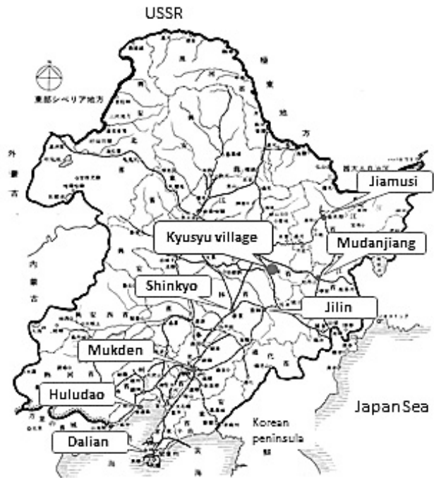
図5 満州国の省と主な都市

約1年間テントを張り共同生活から始め、手で共同開墾を行った。その後、村有林の廃材で丸太小屋を建てて家族を呼び寄せた。屋根は杉の皮を張り、壁はクマ笹で囲った。吹雪の朝は布団の上に雪が積っていた。図6は入植から2年後の「入植者の集合写真」である。配給と既存農家から分けてもらった食糧で空腹を満たしながら、みんなで一緒に開墾を