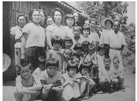
図3 1 開拓保健婦と季節保育所①

後は入植者で初代開拓農業組合長として活躍した田崎京一（以降、田崎）、戦後開拓営農指導員として、間もなく入植者で初代開拓農業協同組合長として活躍した鬼木秀雄、この二人を通して清水開拓地における地域づくりを概観する。