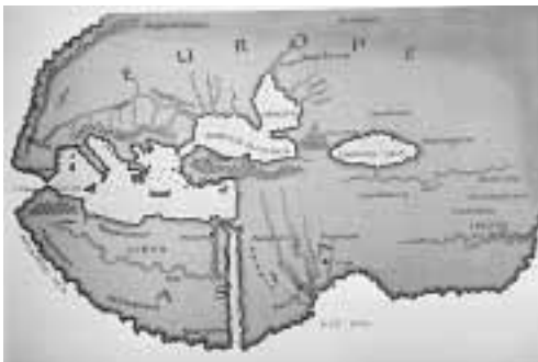
図1 ヘロドトスの地図

まずはアウグスティヌス（354年～430年）に視線を投じたい。『神の国』（412～427年）におけるアウグスティヌスは、それまでのアジアとヨーロッパとアフリカという区分を踏襲している。しかも、それだけではない。アジア人に対する古代ギリシアの哲学者たちの偏見をも、彼は引き継いでしまっているといえるだろう。アウグスティヌスはアジア人のことを、人間ではあるがヨーロッパ人に比べると一段と劣った種族に属するとしたのである。その理由として彼