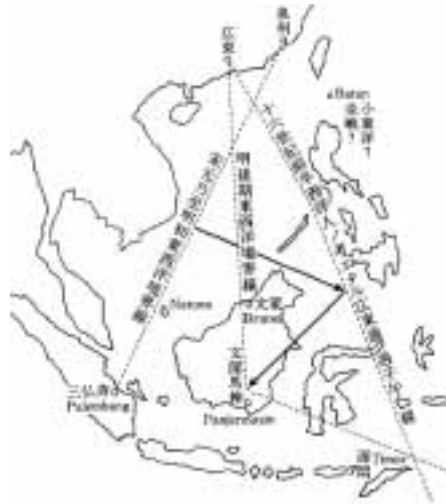
宮崎市定(1942)「南洋を東西洋に分つ根拠に就いて」『宮崎市定全集19』岩波書店、274ページ

方は、その版図が限りなく開けているように思われる。それは航海技術の発達により、海岸線に沿ってより遠くまで遠征できるようになったことと並行している。世界地図を広げてみると明らかなように、東側は太平洋の大きな壁に阻まれている。それにひきかえ西側は、マラッカ海峡を抜けると、陸づたいにインド、アラビア半島、アフリカにまで開かれていることがわかる。漢語としての西洋が、西へ西へと拡大していった理由は、ここにあった。そしてついに、大航海時代のヨーロッパ人によりアジアが発見されてからは、漢語の西洋が、しだいにヨーロッパを指すようになっていく。それにひきかえ漢語としての東洋は、かなり特殊な意味をもっていた。地理的ならびに海洋技術的な理由から、中国は東側の太平洋への航海に積極的ではなかったのだろう。それによって東洋の範囲は、さほど広がっていかなかった。後述するように、極端な例としては日本のみを特別に限定して東洋と呼ぶこともあったほどだ 20) 。