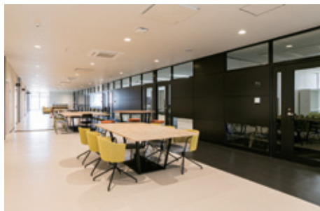
研究室と実験室の間に「コミュニケーション・ワークスペース」を配置し、学生同士・教員の距離が近い環境を整備

※ブロックチェーンとは、暗号資産等を安全にやりとりするための仕組み。今後様々な分野への活用が期待される。