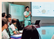
海外ビジネス研修では現地企業などで約3週間就業する。

また、3年次の「海外ビジネス研修」も実践力の養成を目的としたものだ。シンガポールやタイ、ベトナムの企業、団体で就業を体験する。現地訪問前には、訪問国や当該業種の事前研究を行い、帰国後は報告会も開催し、体系的な学びの場としている。